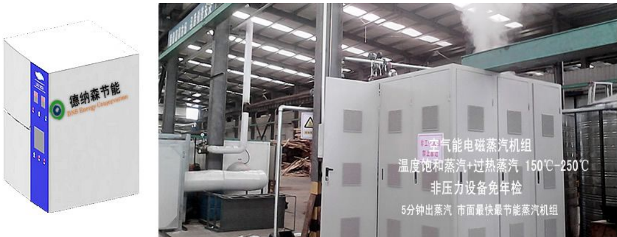
图 1 DNS500 型空气能电磁加热蒸汽机组图（图在山东黑木公司运行图）

本设备已成功在浙江、广西、山东等多地应用。主要应用行业医院、电力、石化、造纸、化工、冶金、院校、服装、洗涤、水泥制品、食品等行业。