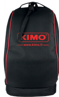
矩阵式风速仪携带包