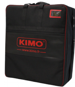
套帽式风量仪携带箱